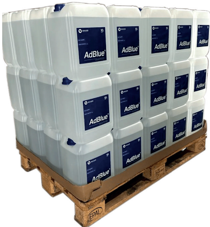
AdBlue® - Kanister Palettenware