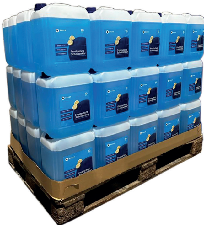
Bauer Blue Scheibenfrostschutz - Palettenware