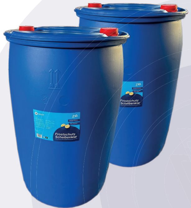
Bauer Blue Scheibenfrostschutz - 210L Kunststoff-Fass