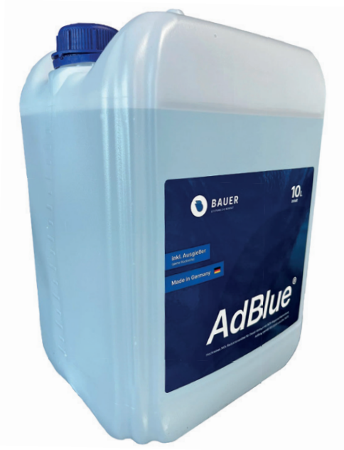
AdBlue® - Kanister mit Flex-Ausgießer