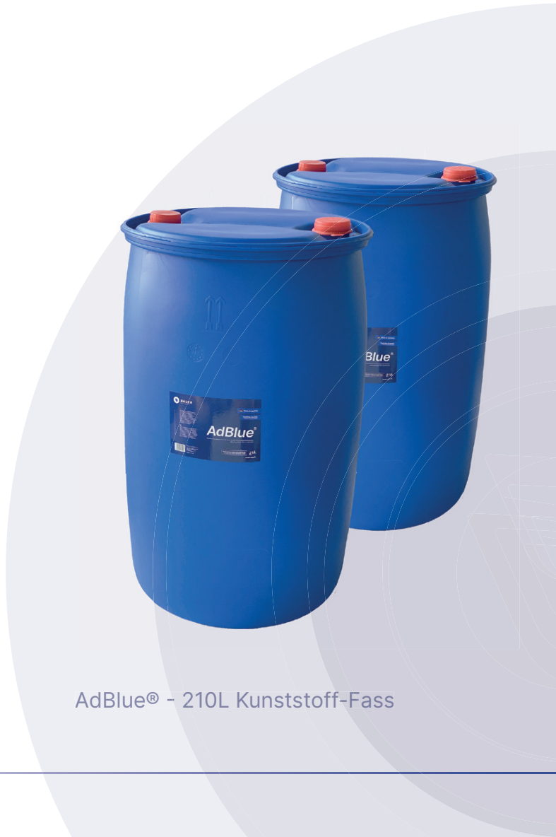
AdBlue® - 210L Kunststoff-Fass