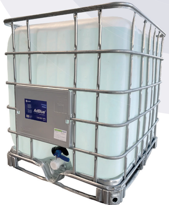
AdBlue® - 1.000L IBC Container