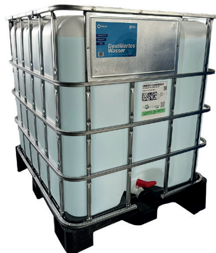
Bauer Blue Destilliertes Wasser 10L, 210L Fass und IBC-Container