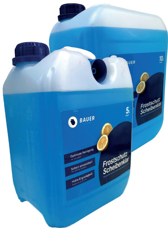
Bauer Blue Scheibenfrostschutz 5L / 10L