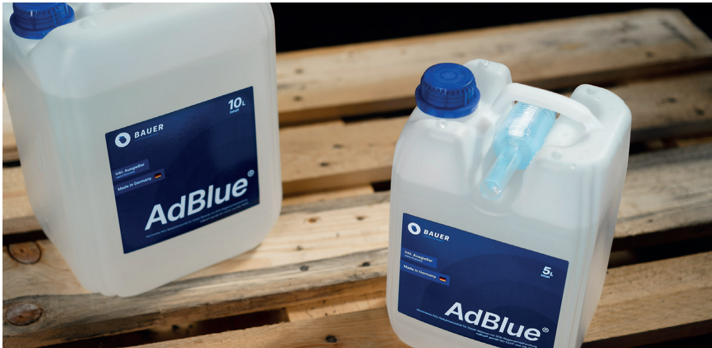
5 Liter und 10 Liter AdBlue® Kanister