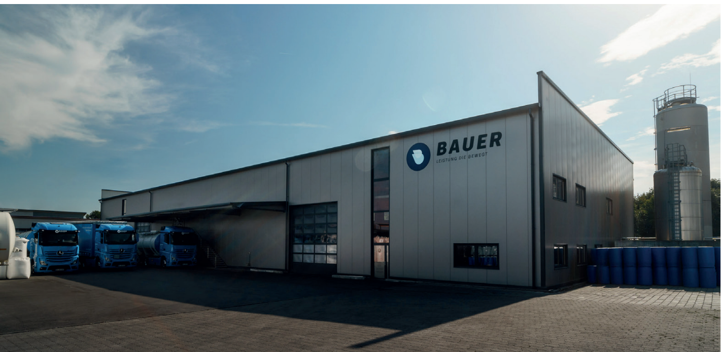
Unser Firmensitz in Ochsenhausen

Unsere Verpflichtung zu Qualität: Ihre Zufriedenheit ist unser höchstes Ziel. Wir setzen uns dafür ein, dass unsere Produkte und Dienstleistungen stets höchsten Qualitätsanforderungen entsprechen. Die Bauer Blue GmbH ist Ihr verlässlicher und regionaler Partner für umweltfreundliche Lösungen.