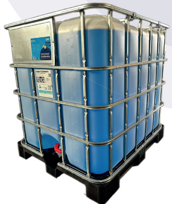
Bauer Blue Scheibenfrostschutz - 1.000L IBC-Container